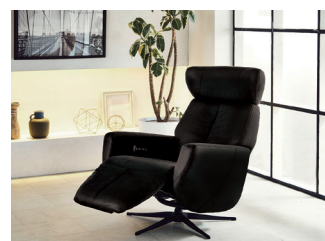
術後のリカバリーチェア