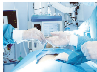
腹腔鏡で最小限の傷跡